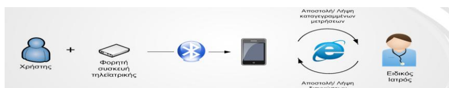
Σχήμα : Λογικό διάγραμμα λειτουργίας συστήματος τηλεματικής παρακολούθησης ατόμου

Πιο συγκεκριμένα για την υλοποίηση του Υποσυστήματος Τηλεματικής Παρακολούθησης ο χρήστης πρέπει να διαθέτει εκτός από τη συσκευή και ένα κινητό τηλέφωνο, που χρησιμεύει για την ασύρματη μεταφορά – μέσω Bluetooth -, των δεδομένων που καταγράφονται. Οι μετρήσεις προωθούνται εν συνεχεία σε προεπιλεγμένο κέντρο λήψης και επεξεργασίας σημάτων, στο οποίο μελετώνται οι καταγραφές και παρέχεται διάγνωση. Στην συσκευή του κινητού τηλεφώνου θα πρέπει να εγκατασταθεί εξειδικευμένο λογισμικό για τη μεταφορά του ιατρικού σήματος στην κεντρική βάση δεδομένων, ενώ απαιτείται και κάρτα SIM με ενεργοποιημένη την υπηρεσία GPRS ώστε να εξασφαλίζεται η αποστολή δεδομένων.